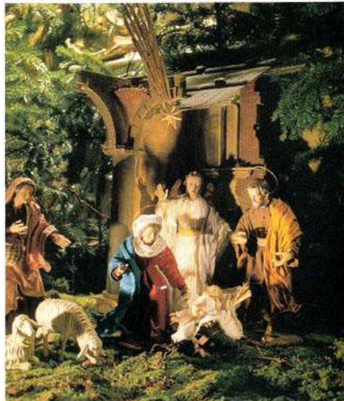
K L O S T E R K I R C H E C H R I S T I G E B U R T