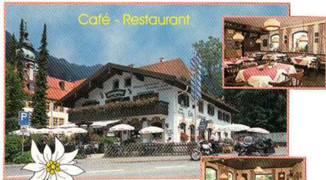
Café - Restaurant